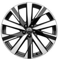
5マルチスポーク 9.0J×20インチ ダイヤモンドカット/ブラック