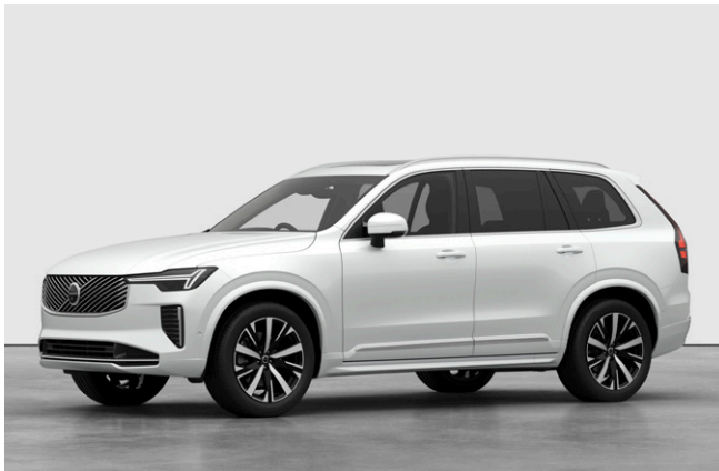
XC90 Plus B5 AWD