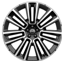
7ダブルスポーク 9.0J×22インチ ダイヤモンドカット/ブラック