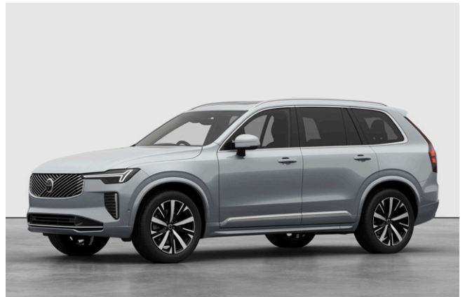
XC90 Ultra B5 AWD