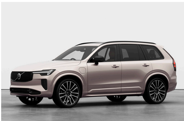
XC90 Ultra T8 AWD Plug-in hybrid