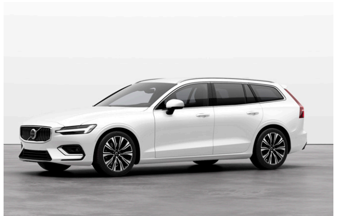
V60 Ultra B4