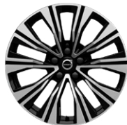
5マルチスポーク 8.0J×18インチ ダイヤモンドカット/ブラック