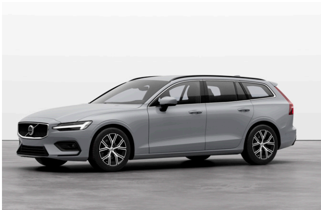
V60 Plus B4