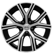
5-Yスポーク 7.0J×17インチ ダイヤモンドカット/ブラック