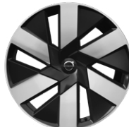
6スポーク 8.0J×19インチ ダイヤモンドカット/ブラック