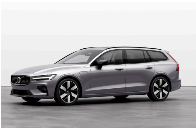
V60 Ultra T6 AWD Plug-in hybrid